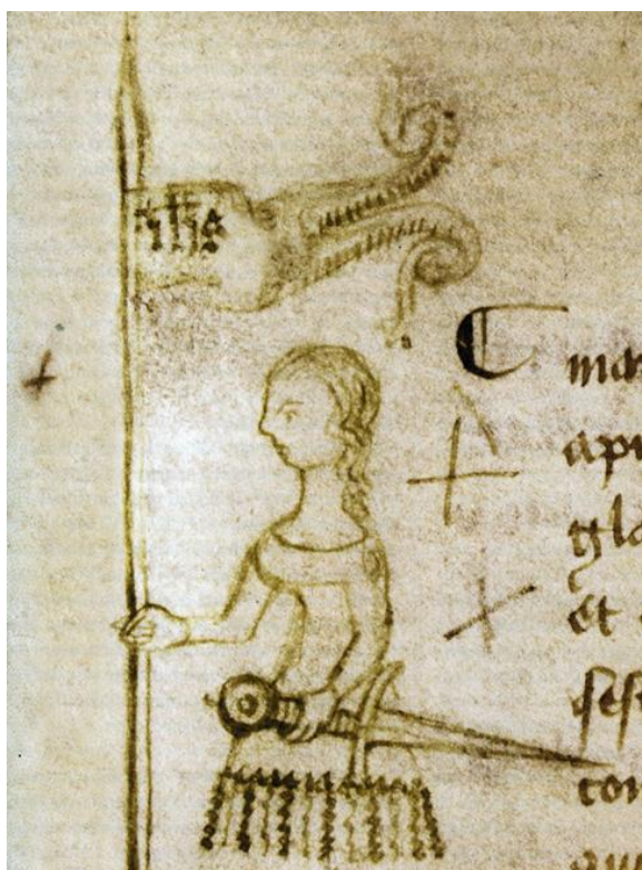
Miniature représentant Jeanne d'Arc arborant sa bannière 18 .