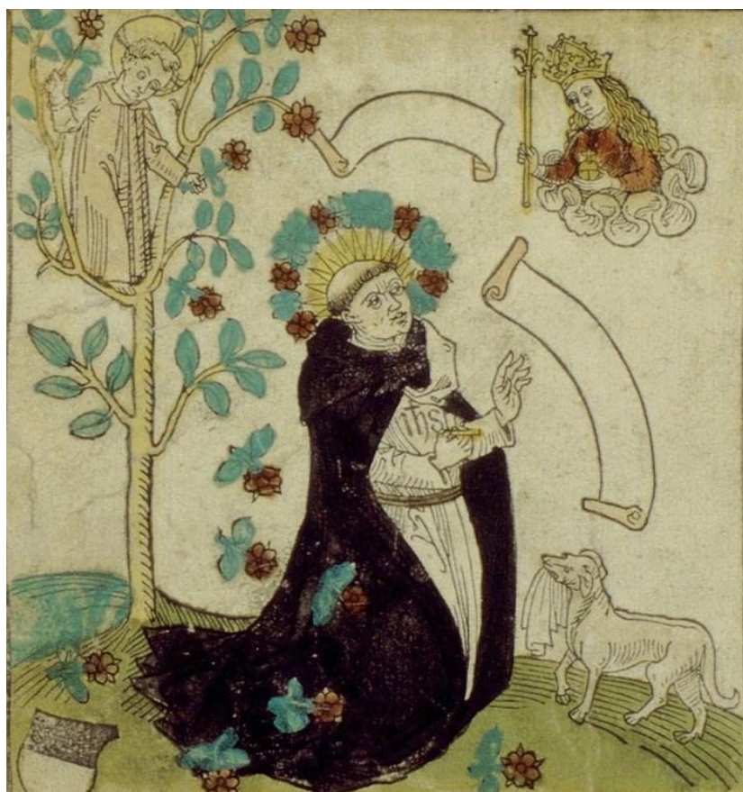
Henri du Suso, gravant l'IHS sur sa poitrine 11

Faire corps au sens figuré, mais faire corps également au sens littéral du terme. Henri de Suso, grand mystique dominicain du XIVe siècle, inscrit le Nom de Jésus sur sa poitrine. Le cœur est lieu des sentiments, des affects. Il est la caisse de résonance des passions humaines et l'élément qui avec l'âme permet au chrétien d'aimer. Quel meilleur support, quel meilleur médium pour le fidèle et son Dieu ; lequel fait de la charité, c'est-à-dire de l'amour de Dieu, la principale des vertus ? Le corps est un intermédiaire, par la bouche qui profère des louanges, par l'esprit qui médite sur la puissance du Nom de Jésus, par la chair qui sert de matériau brut à l'inscription.