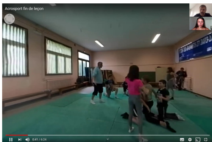
Figure 3. Capture d'écran du partage de la vidéo 360° lors d'un TD

comprendre l'organisation spatiale de la classe (matériels, groupes d'élèves, etc.) et les activités conjointes de l'enseignant et des élèves. La problématique du maintien des élèves au travail est récurrente chez les étudiants. Elle les conduit à réfléchir aux potentialités d'action qui s'offrent à l'enseignant et à envisager de nouvelles façons d'intervenir auprès des élèves : modalités de régulation collectives et/ou individuelles, régulation tactile des conduites motrices, dimensions proxémiques des gestes professionnels, recours à des supports tels que des fiches ou une tablette numérique, etc.