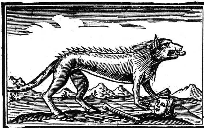
Canis quærens quem devoret.

Plus inquiétant, l'aristocrate, qui revêt la peau du loup des légendes : « la gueule ensanglantée, l'œil creux, le poil hérissé, la rage au cœur », prêt à dévorer l'imprudent mouton, tel que le veut La Lanterne patriotique et que le représente le frontispice de la Lettre d'un chien aristocrate . Ce petit chef-d'œuvre d'ironie met en scène un chien, émule de Figaro, qui revendique ses origines « aussi anciennes, aussi pures que race et noblesse d'Europe » et reposant « sur les mêmes bases : l'impudence d'une part, et la crédulité de l'autre ». De son ancêtre voué à la défense du Capitole, et pendu pour avoir préféré à cette mission la chienne de Manlius, à ses descendants mordant les jambes des plébéiens et les tribuns du peuple, trahissant Marius puis Sylla, aidant aux combats du despotisme aux côtés du duc d'Albe, du Grand Inquisiteur, contre les Indiens d'Amérique ou contre Lafayette enfin, est dessiné un arbre généalogique aux racines fragiles et aux branches pourries - la Révolution venue, le chien se fait mouche (de police, s'entend), épiant chacun et partout furetant, des maisons aux boutiques, des cabarets aux églises, des cafés aux clubs. Le tout en réponse aux a priori sociaux de l'émigrante noblesse française, ou aux thèses de Boulainvilliers et de Saint-