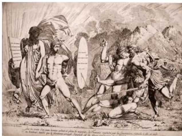
AD Rhône, A 114

Dans cette extase patriotique, tous les convives ont regretté que de pareils festins ne fussent pas plus souvent à l'ordre du jour. Pour établir l'égalité parfaite, quelques-uns ont proposé que les états-majors, que les administrateurs, que tous les fonctionnaires publics mangeassent désormais, chaque jour de décade, à la gamelle. Cette proposition a été généralement applaudie et l'assemblée, par ses acclamations, a témoigné combien elle désiroit la voir réaliser ». 19