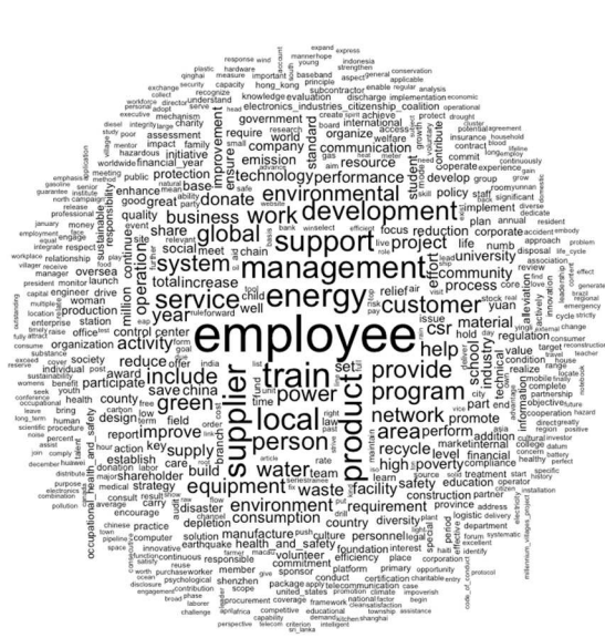
Figure 1 : Nuage et fréquence des mots sur le corpus activités